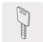
Llave de puntos