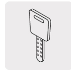
Llave de puntos