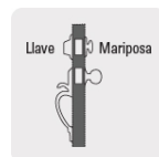
Llave - mariposa