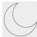
Uso de noche