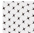
Tejido de punto en ala