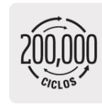
Cierre y apertura