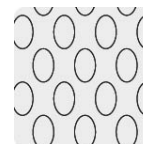
Malla al reverso