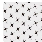
Tejido de punto en ala