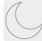
Uso de noche