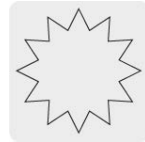
Uso de día