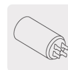
Capacitor, mayor potencia al arranque