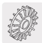
Impulsor de latón